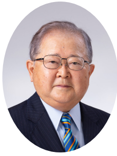
国際ロータリー第2670地区 2025-2026年度 ガバナー